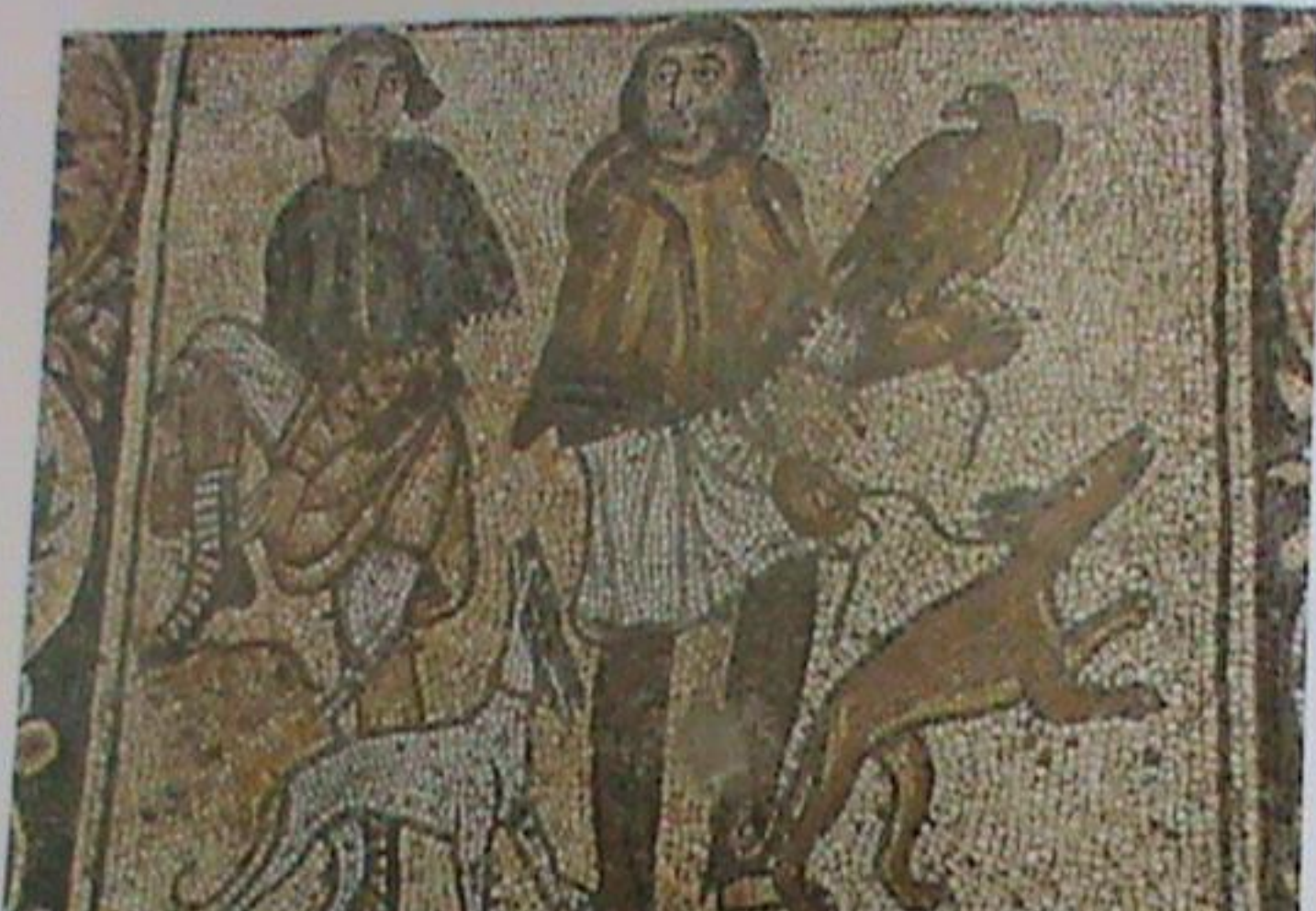
4.1 Argos. Hare Coursing and Falconry Mosaic, panel 1.

Κυνήγι με ειδικά εκπαιδευμένο γεράκι και κυνηγετικούς σκύλους (500 μ.Χ., ψηφιδωτό, από πρωτοβυζαντινή έπαυλη στο Άργος)