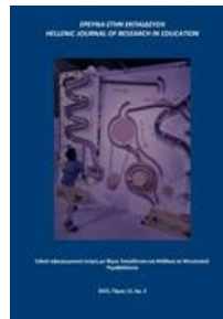
Εκπαίδευση και μάθηση σε μουσειακά περιβάλλοντα: Τόμ. 12 Αρ. 2 (2023)

Περισσότερα επιστημονικά περιοδικά στην πλατφόρμα eJournals