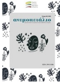
Ανεμοπετάλιο: Τόμ. 2, Αρ.2 (2023)