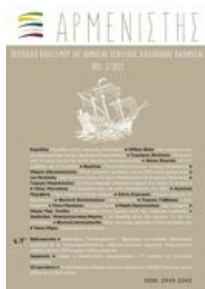
Αρμενιστής: Τόμ. 1 Αρ. 1 (2023)