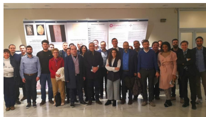
Εκδήλωση για την επιχειρηματικότητα στον τομέα της Υγείας από NBG Business Seeds, EKT και EIT Health