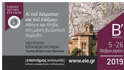
Νέος κύκλος διαλέξεων στο EIE με θέμα «Αί του Κέκροπος και του Κάδμου: Αθήνα και Θήβα στη μέση βυζαντινή περίοδο»