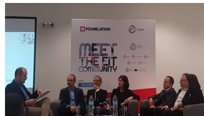
Οι Κοινότητες Γνώσης και Καινοτομίας του EIT στο επίκεντρο εκδήλωσης στην Αθήνα