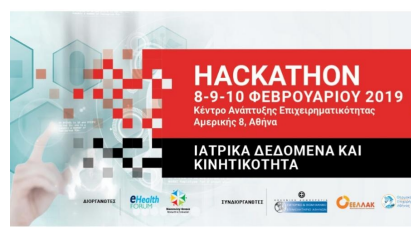
Μαραθώνιος εφευρετικότητας για την Υγεία και την Καινοτομία στο 1ο Hacking Health Athens Hackathon