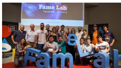
Διαγωνισμός FameLab 2019 για τα νέα ταλέντα στην Επικοινωνία της Επιστήμης