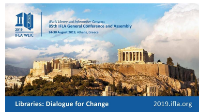
Το 85ο Συνέδριο της Διεθνούς Συνομοσπονδίας Ενώσεων Βιβλιοθηκών (IFLA WLIC 2019), τον Αύγουστο στην Αθήνα