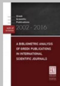
Greek Scientific Publications 2002-2016 (Web of Science)

Αρχείο newsletter - Εγγραφή | Επικοινωνία