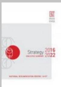
Strategy 2016-2022 (Executive Summary)