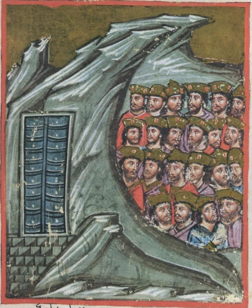
Τα αποκλεισμένα 22 μιὰρά ἔθνη πέρα ἀπὸ τὶς Κασπίες πύλες. Εἰκονογραφημένο χεῖρόγραφο Μυθιστορήματος τοῦ Ἀλεξάνδρου. 14 ος αἰ. Ἑλληνικὸ Ἰνστιτούτο Βενετίας.

+ ἐκείσε αὐτὸν ἡλεξάνδρου κερβασι γειτὶς ἄβραυπο κλάσασιν ἀπὸ τῆς κτῆσιν τοῖς ὑπὸ αὐτοῖς ἔθνεσιν ἡ ἐκείσε ἀπὸ τῆς ἀσπίδος τοῦ βορρᾶ ὄρημα τῆς δεξιᾶς κασπίας τῆς δεξιᾶς ὄρημα τῆς δεξιᾶς