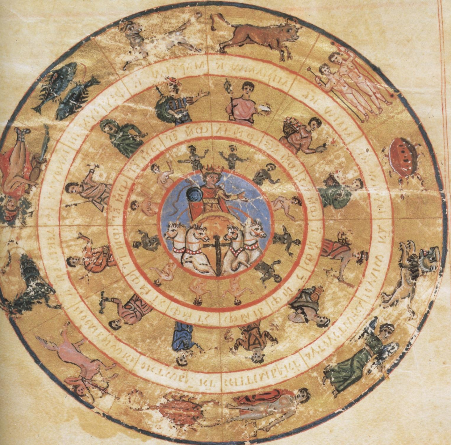
Ήλιος και ζωδιακός κύκλος. Αστρονομικοί πίνακες Κλαύδιου Πτολεμαίου. 753/4. Περγαμηνή. Βατικανό.