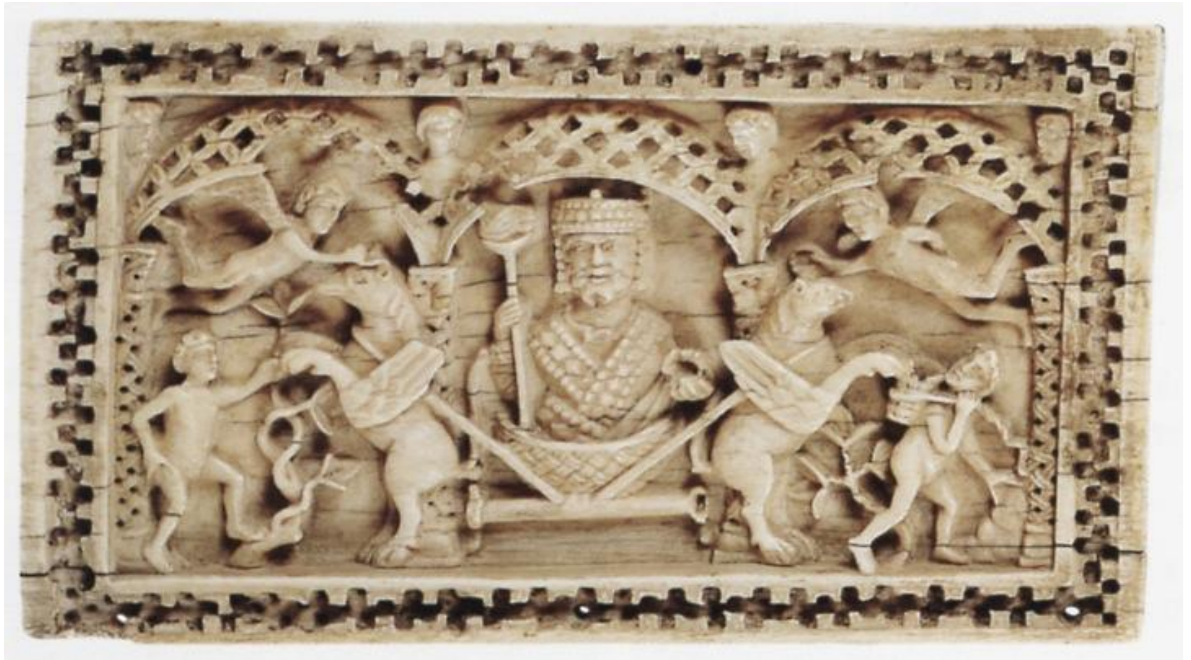
Ανάληψη Αλεξάνδρου σε ελεφαντοστέινο κιβωτίδιο. Α΄ μισό 10 ου αι. Darmstadt. Hessisches Landesmuseum.