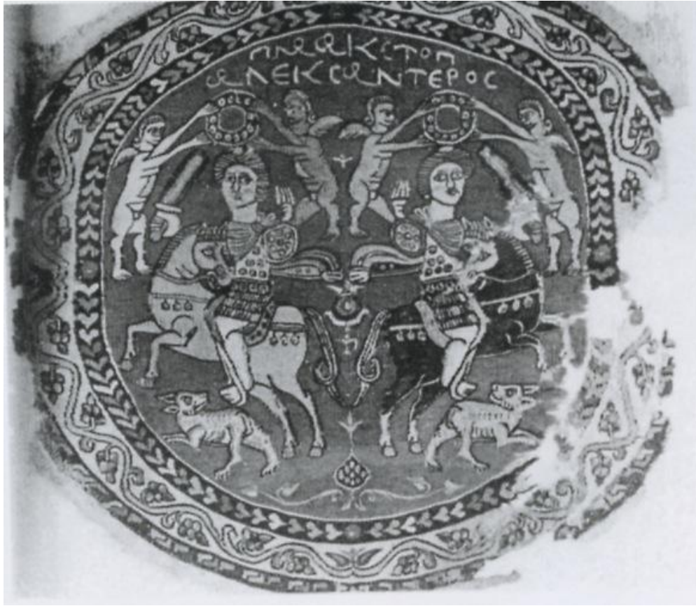
Ο Αλέξανδρος κυνηγός, ύφασμα, 7 ος - 8 ος αι., Ουάσινγκτον, Μουσείο υφασμάτων.