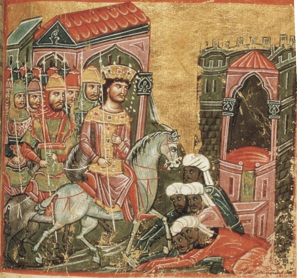
Ο Αλέξανδρος καταλαμβάνει τα βασίλεια του Πύρου. Εικονογραφημένο χειρόγραφο Μυθιστορήματος του Αλεξάνδρου. 14 ος αι. Ελληνικό Ινστιτούτο Βενετίας.

οὐκ αὐτὸ καὶ κατὰ τὸ βορρῶν μέρος ἐλθεῖν· καὶ πρὸς τὴν ὁδὸν τὴν φέρουσαν εἰς τὴν Πρωσσικήν γῆν· ἢ τὴν δὲ Κε- κροπόλιν εἶναι τῆς Ἰνδίας χερσονήσου· ἐν ταύτῃ πόρῳ Ἰσχυροῦ· καὶ πᾶν τὰ οἰκουμένην δαῖμα μετ' ἑαυτοῦ ἀπέ- λαμψε τὸν ἀλέξανδρον· ὡς πᾶν τα κατὰ φύσιν οἰκουμένην τῆς