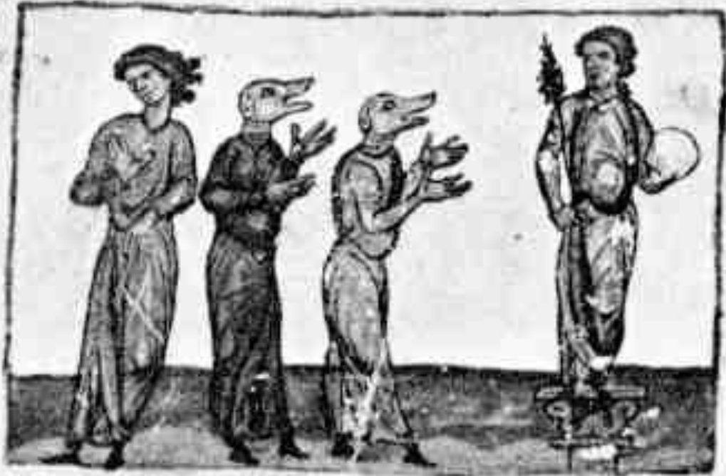
Κυνοκέφαλοι. Εικονογραφημένο χειρόγραφο. 10 ος – 11 ος αι. Παρίσι. Εθνική Βιβλιοθήκη.

ἄλλοι ἀφ' αὐτῶν. ὁ μὲν οὖν ἦν ἐπικρῶν σατάνου.