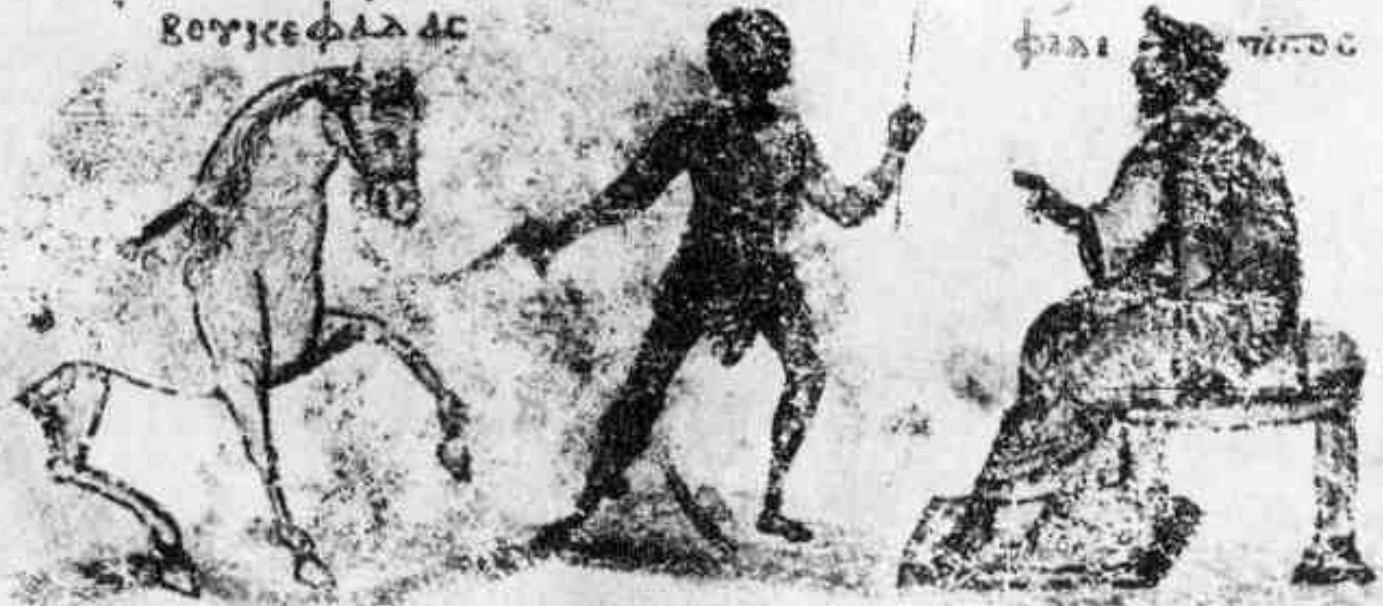
Ο Βουκεφάλας και ο Φίλιππος. Εικονογραφημένο χειρόγραφο. 10 ος – 11 ος αι. Βενετία. Μαρκιανή Βιβλιοθήκη.