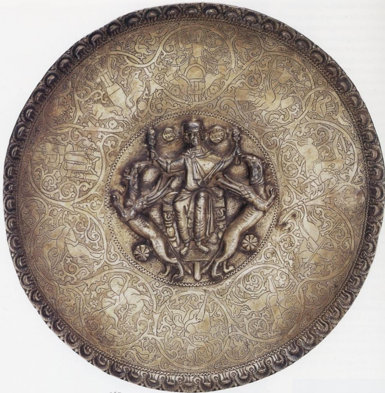
Ανάληψη Αλεξάνδρου σε ασημένιο πινάκιο. 1208- 1216. Σιβηρία. Περιφερειακό Μουσείο Shuryshkar.