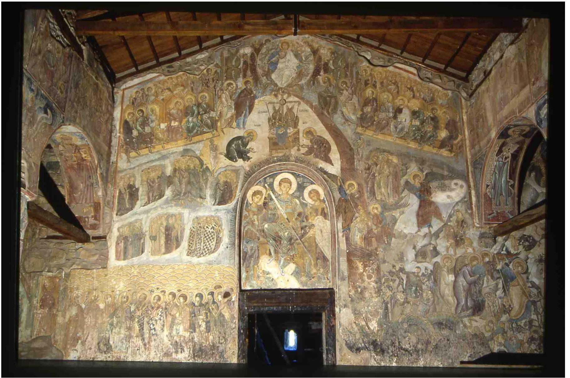
Η Δευτέρα Παρουσία. Τοιχογραφία, μετά το 1570. Ναός Αγίου Δημητρίου στα Παλατίτσια Ημαθίας.