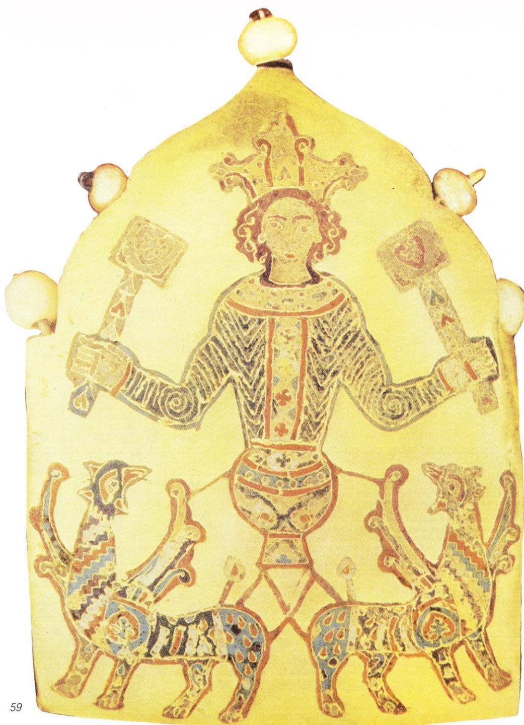
Η Ανάληψη του Αλεξάνδρου σε διάδημα με σμάλτα. 12 ος – 13 ος αι. Κίεβο. Ιστορικό Μουσείο.