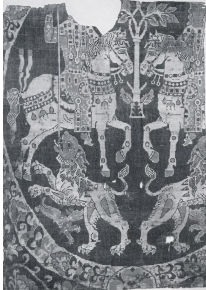
Βασιλικό κυνήγι, 8 ος αι., ύφασμα, Λυών, Ιστορικό Μουσείο Υφασμάτων