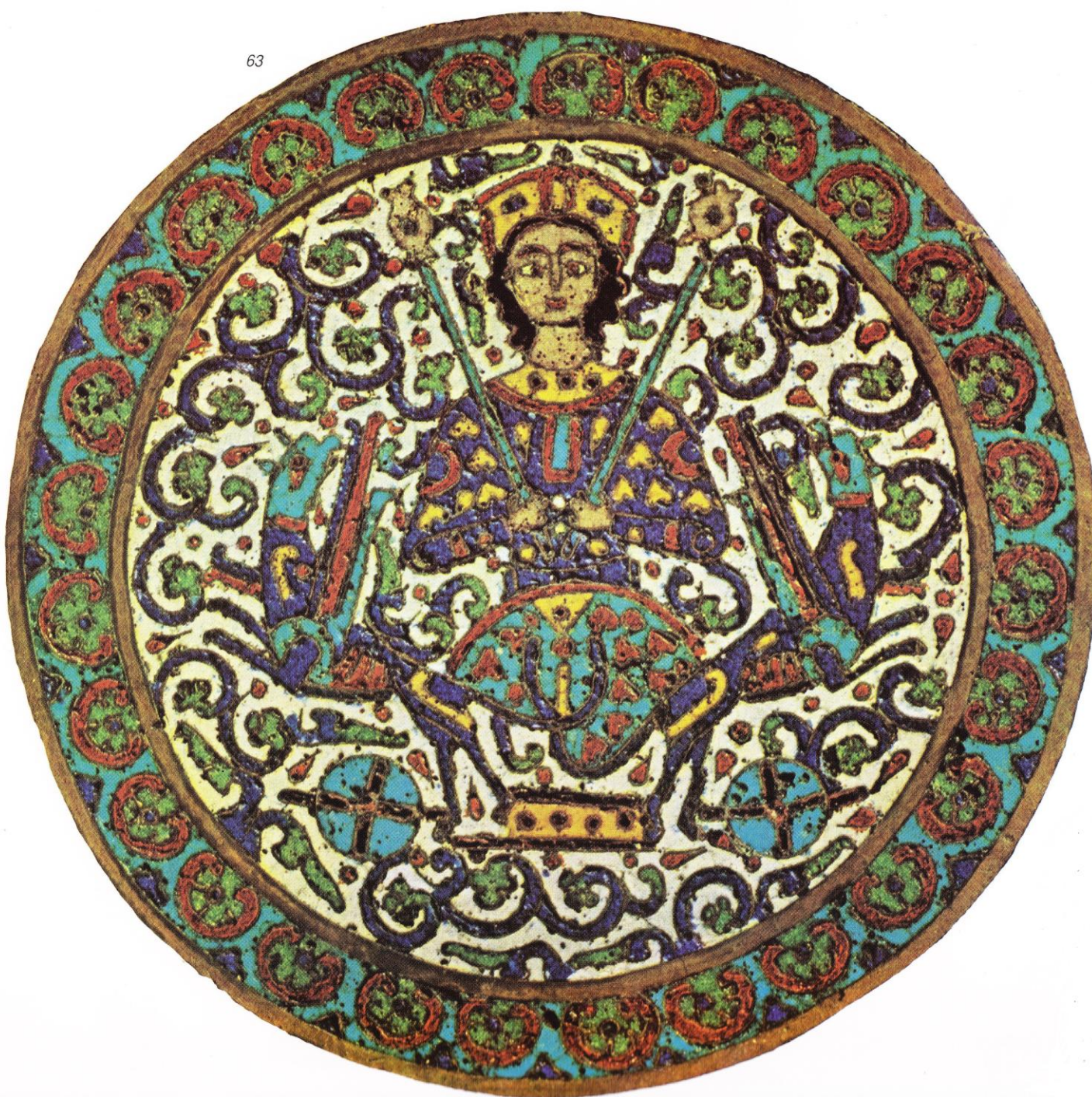
Ανάληψη Αλεξάνδρου σε πινάκιο με περίκλειστα σμάλτα. 1114-1144. Innsbruck. Tiroler Landesmuseum.