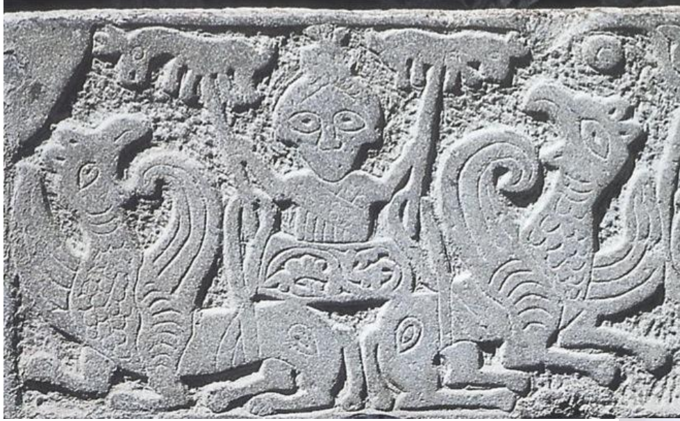
Μαρμάρινη πλάκα με Ανάληψη Αλεξάνδρου. 12 ος αι. Φρούριο Χαλκίδας.