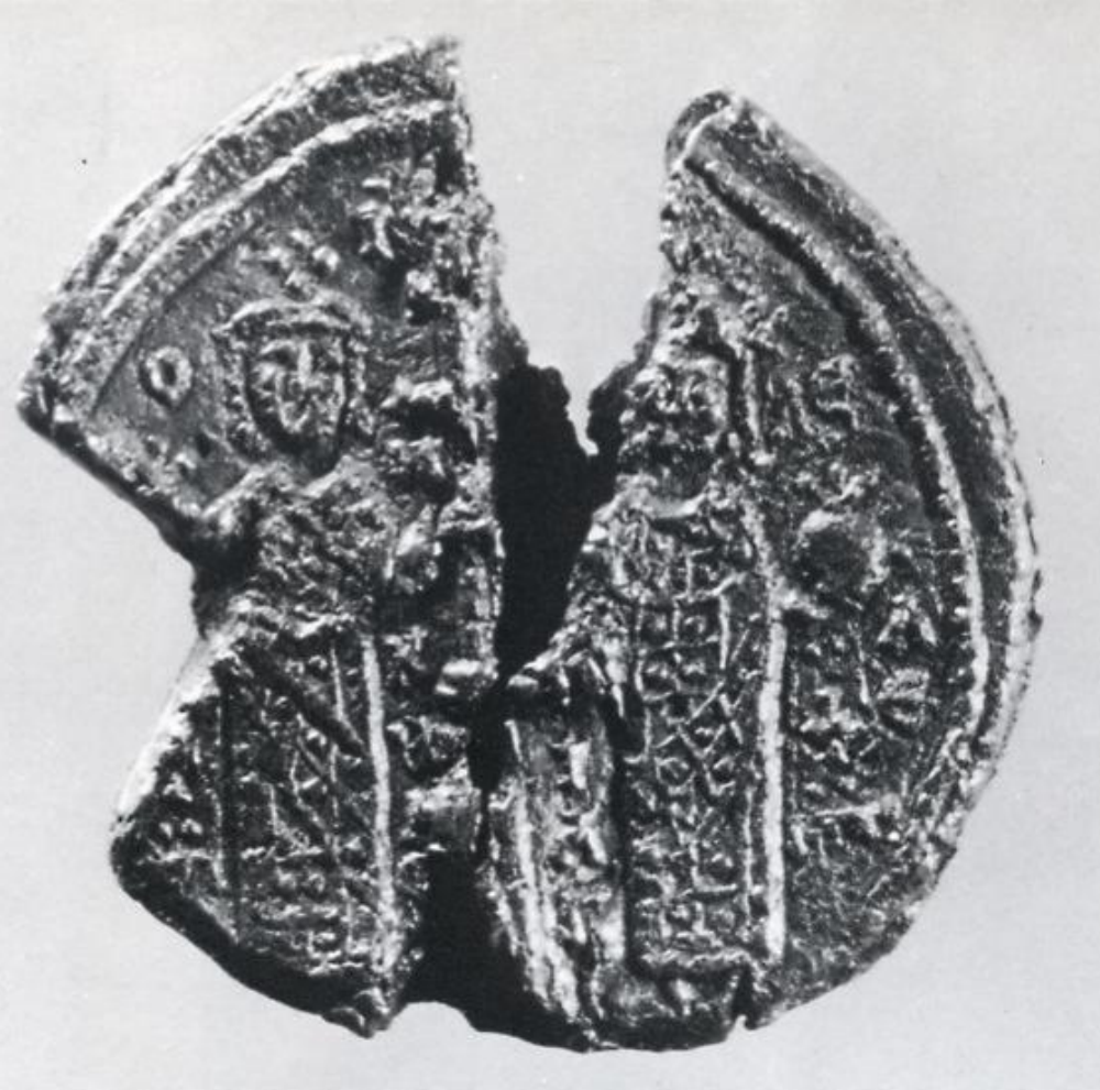
Κωνσταντίνος και Ελένη – Ανάληψη Αλεξάνδρου. Μολύβδινη σφραγίδα-φυλακτό. 10 ος αι. Αγ. Πετρούπολη. Μουσείο Ερμιτάζ.