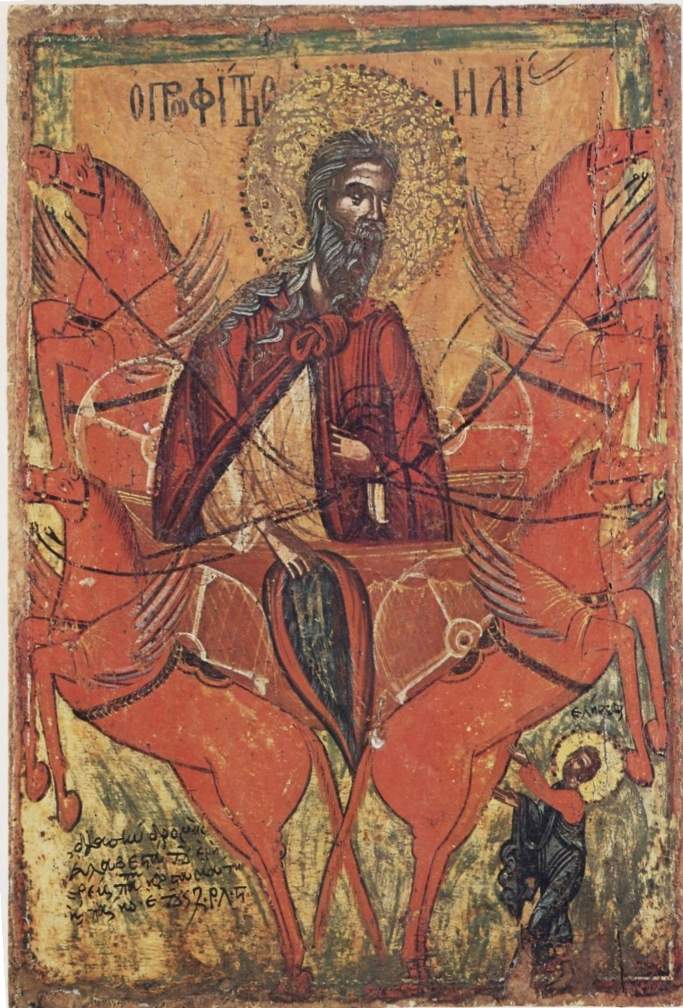
Ανάληψη του Προφήτη Ηλία. Εικόνα. 1628/9, Συλλογή Δ. Οικονομόπουλου. Θεσσαλονίκη. ΜΒΠ