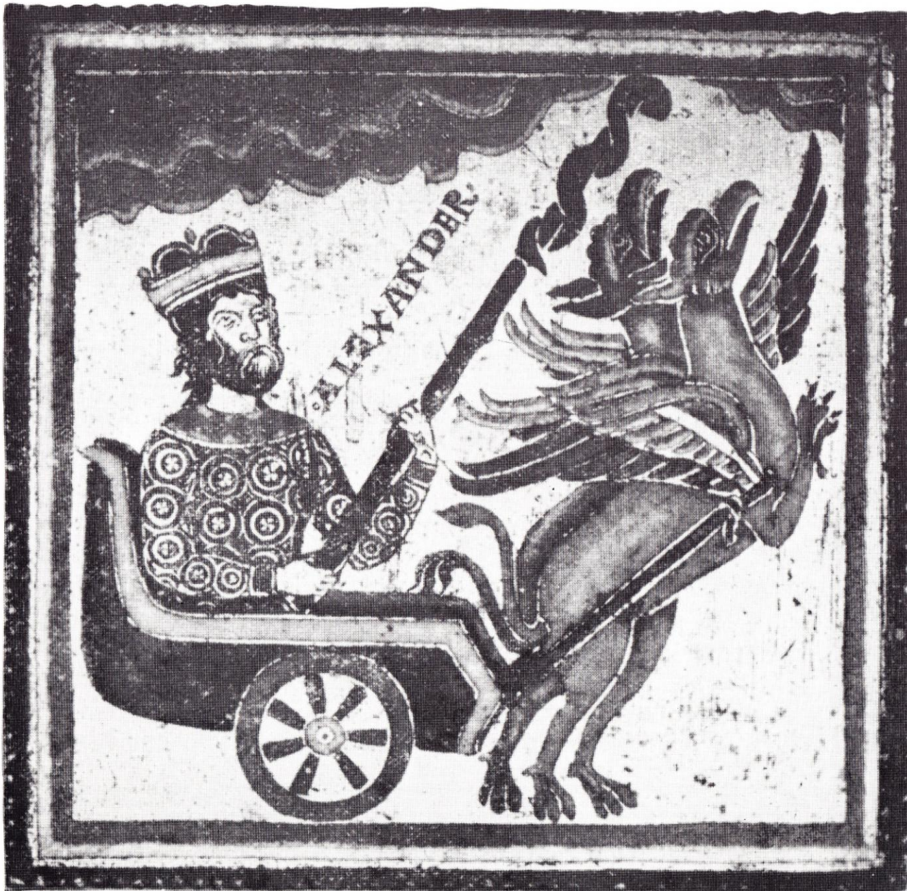
Ανάληψη Αλεξάνδρου σε πλάκα με σμάλτο. Μέσα 12 ου αι. Λονδίνο. Μουσείο Victoria and Albert.