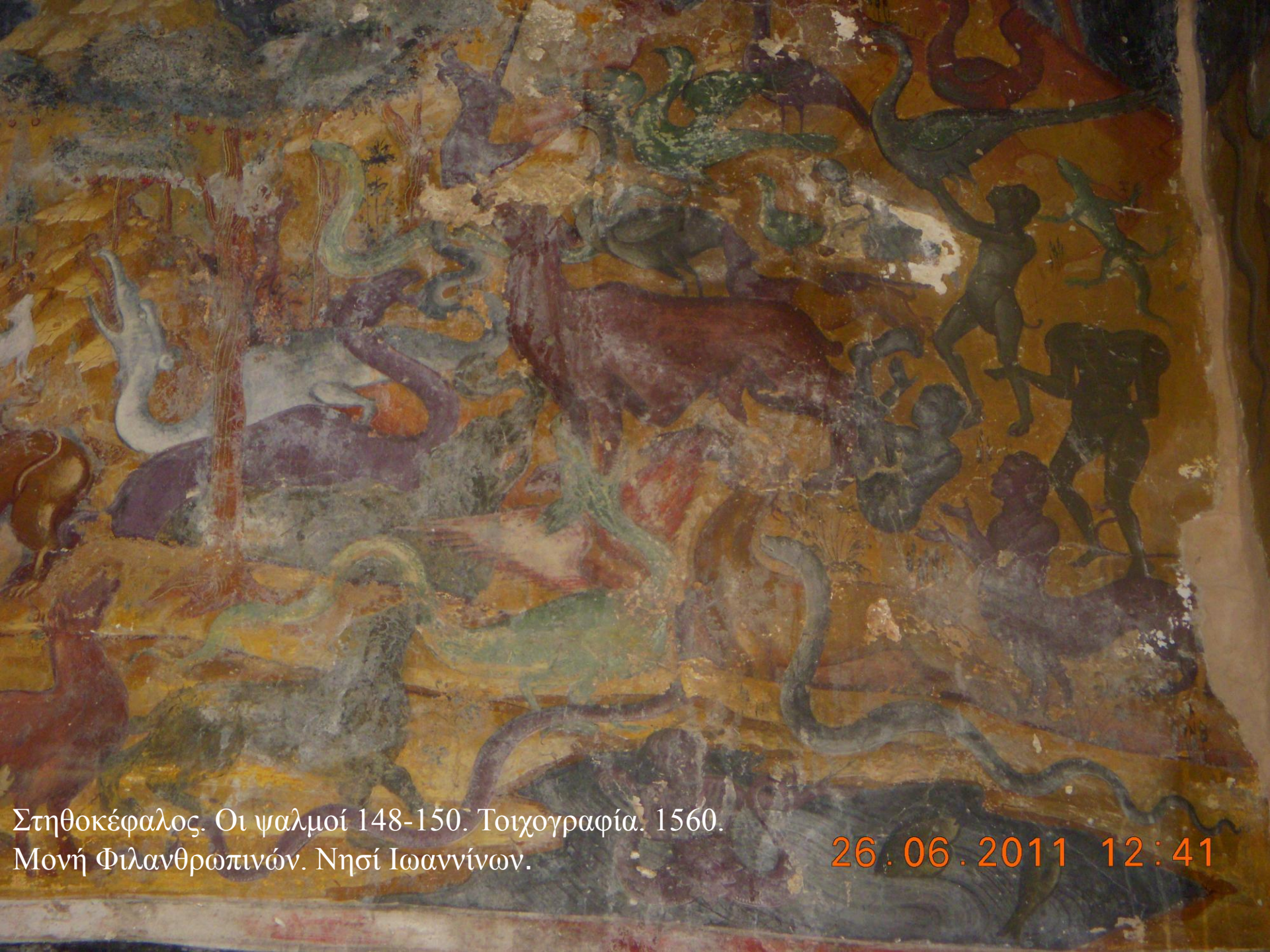
Στηθοκέφαλος. Οι ψαλμοί 148-150. Τοιχογραφία. 1560. Μονή Φιλανθρωπινών. Νησί Ιωαννίνων.