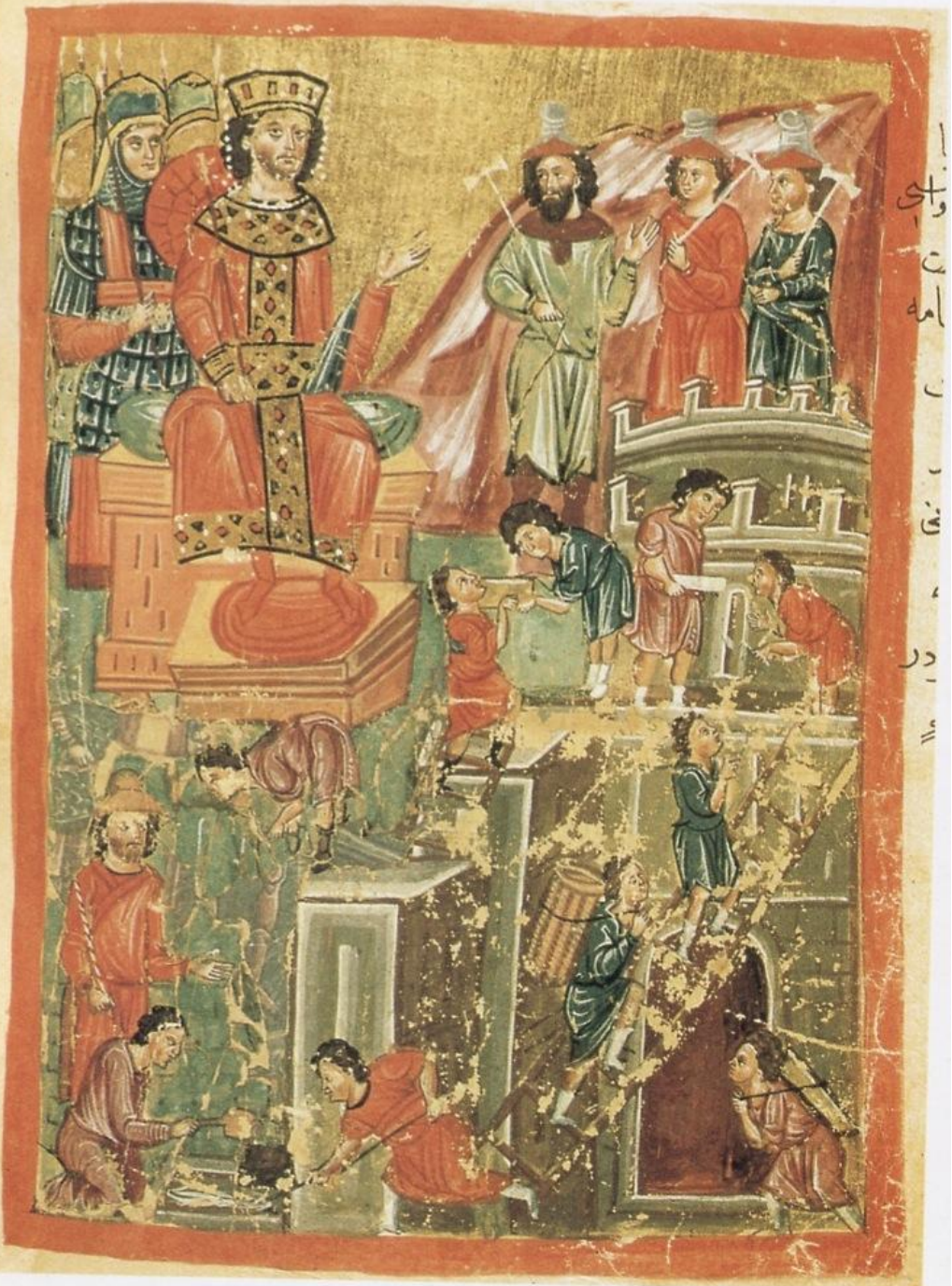
Ο Αλέξανδρος κτίζει την Αλεξάνδρεια. Εικονογραφημένο χειρόγραφο Μυθιστορήματος του Αλεξάνδρου. 14 ος αι. Ελληνικό Ινστιτούτο Βενετίας.