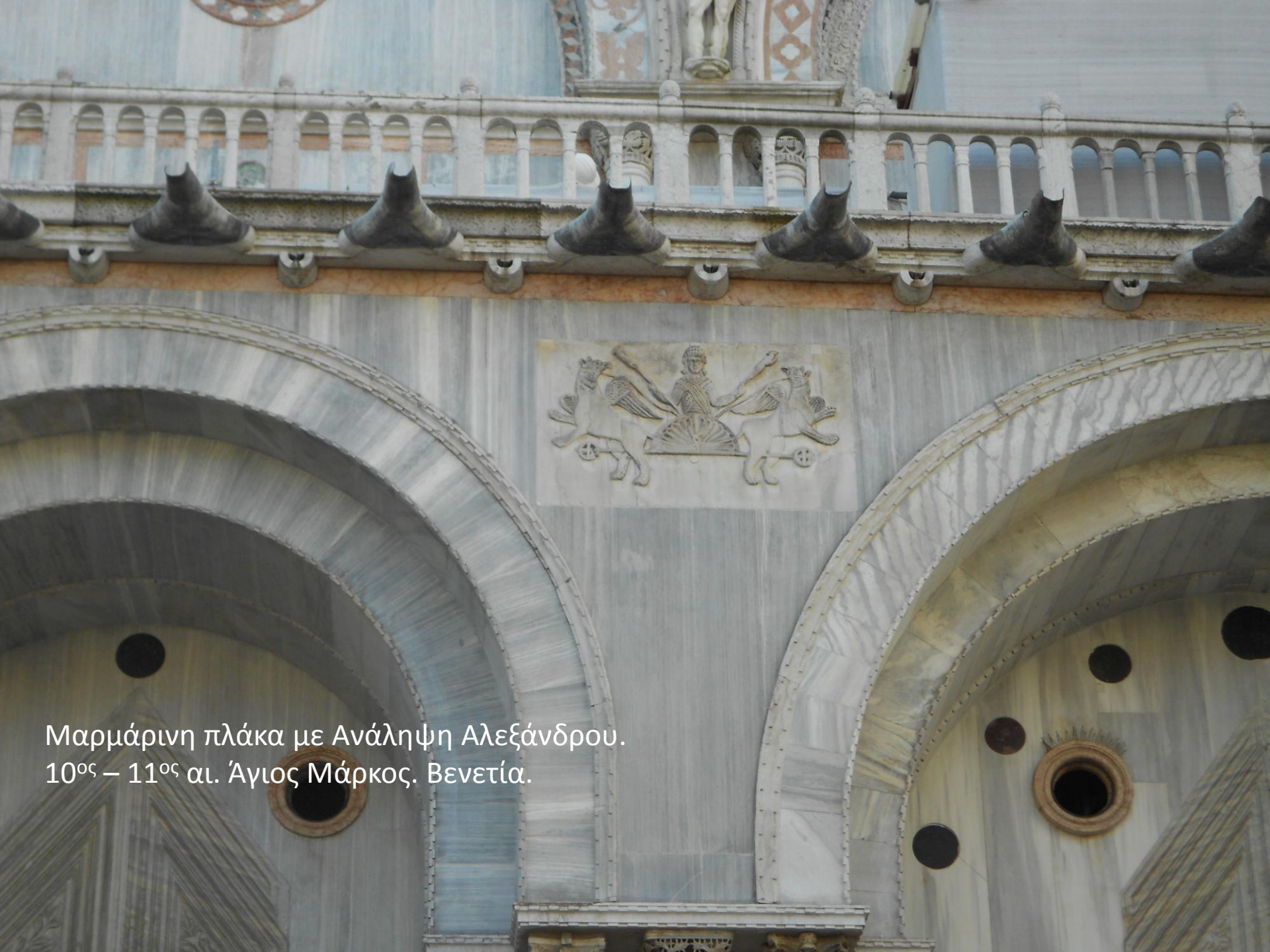
Μαρμάρινη πλάκα με Ανάληψη Αλεξάνδρου. 10 ος – 11 ος αι. Άγιος Μάρκος. Βενετία.