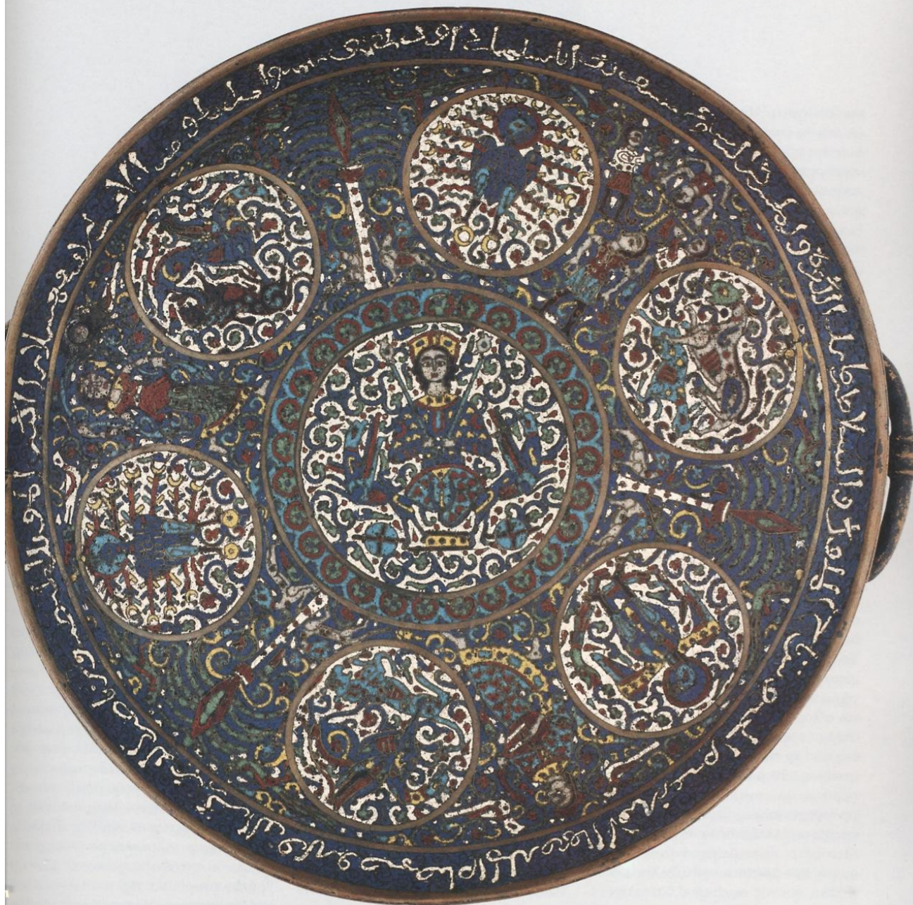
Ανάληψη Αλεξάνδρου σε πινάκιο με περίκλειστα σμάλτα. 1114-1144. Innsbruck. Tiroler Landesmuseum.