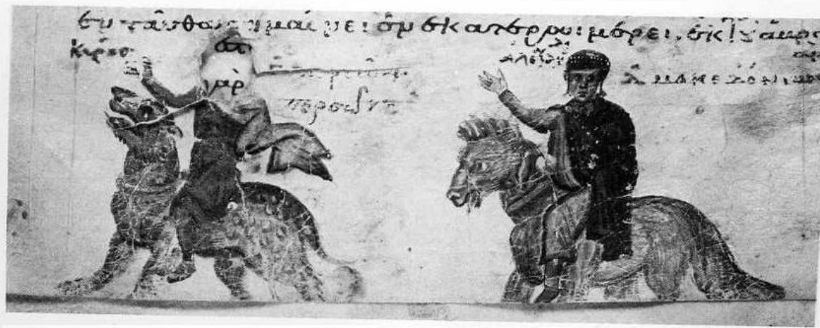
Το όραμα του προφήτη Δανιήλ για τα τέσσερα θηρία. Χειρόγραφο Χριστιανικής Τοπογραφίας του Κοσμά Ινδικοπλέυστη. 11 ος αι. Μονή Σινά.