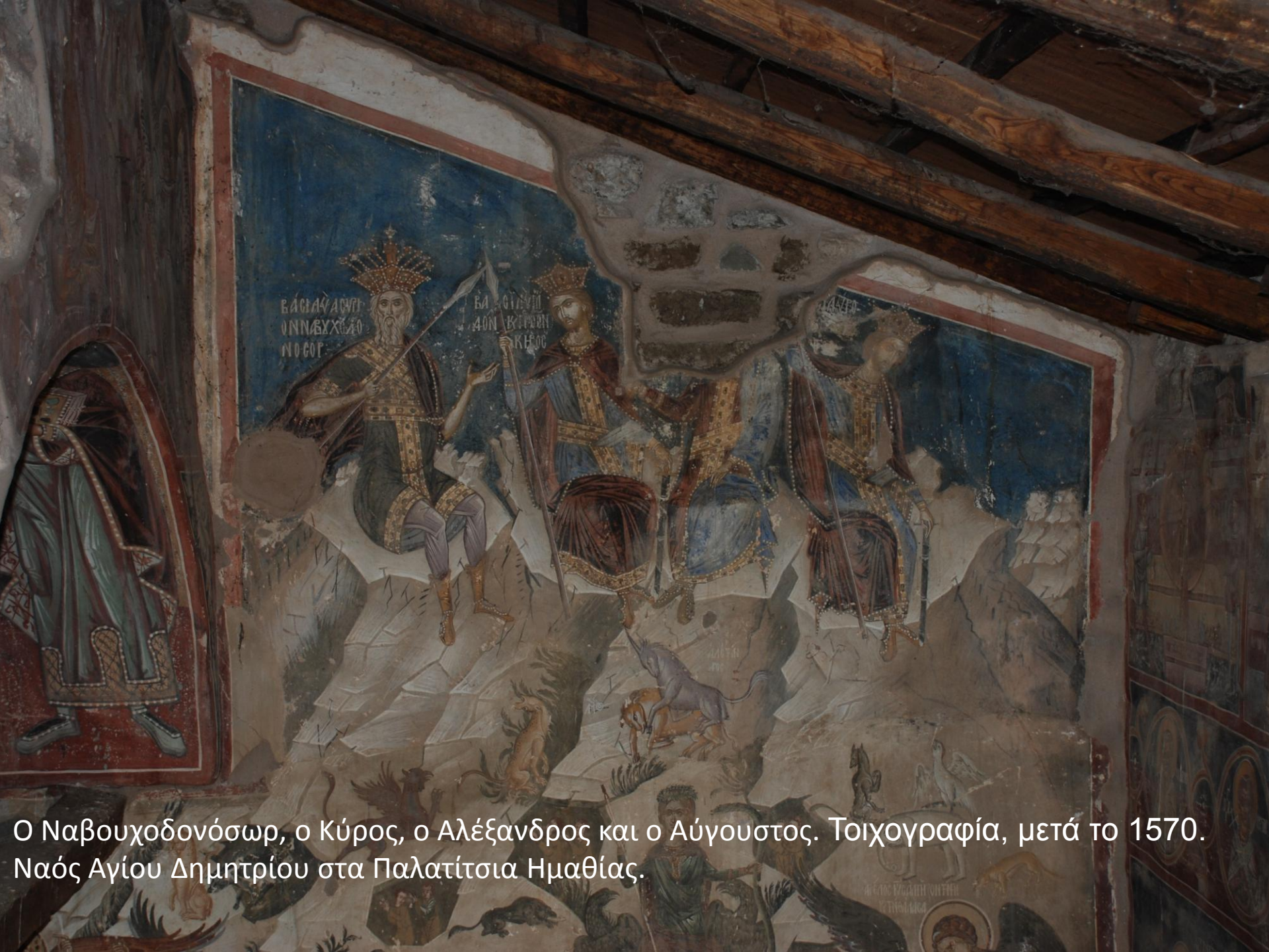
Ο Ναβουχοδονόσωρ, ο Κύρος, ο Αλέξανδρος και ο Αύγουστος. Τοιχογραφία, μετά το 1570. Ναός Αγίου Δημητρίου στα Παλατίσια Ημαθίας.