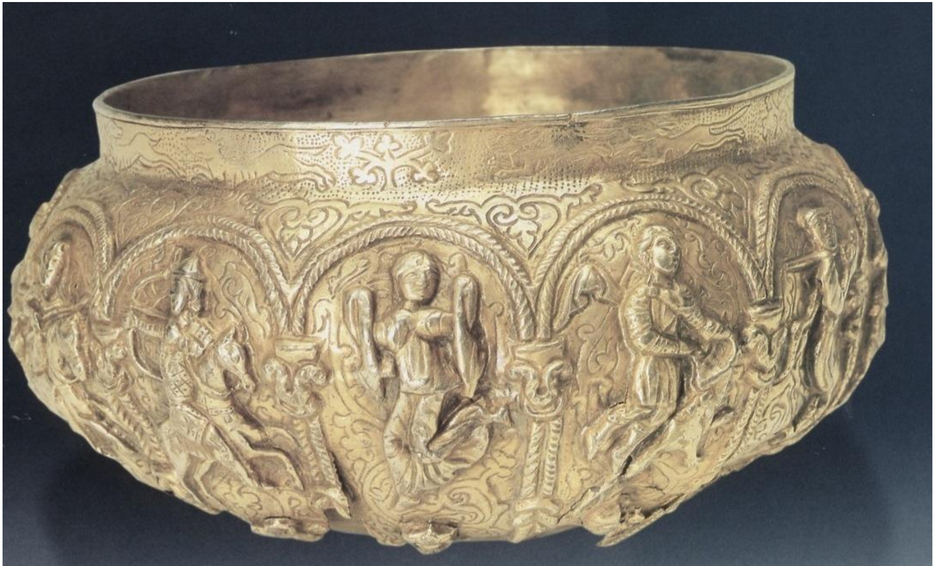
Η Ανάληψη του Αλεξάνδρου. Επιχρυσωμένο κύπελλο. 12 ος αι. Αγ. Πετρούπολη. Μουσείο Ερμιτάζ.