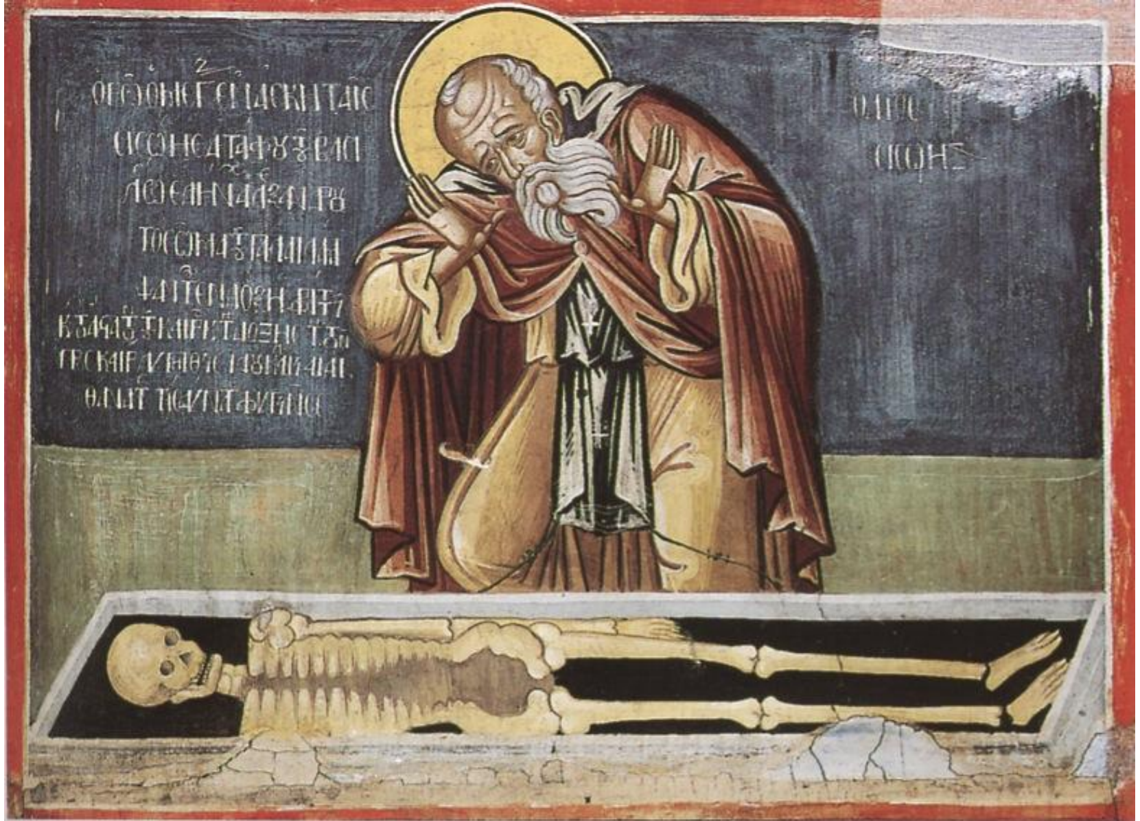
Ο Αββάς Σισώης μπροστά στον τάφο του Μεγάλου Αλεξάνδρου. Τοιχογραφία. 1566. Μονή Βαρλαάμ Μετεώρων.