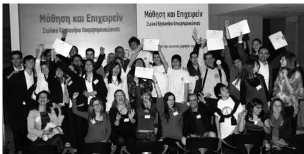
Οι βραβευμένες ομάδες του Λυκείου και του Γυμνασίου.