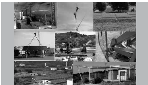
Σημαντικά ερευνητικά έργα υλοποιούνται από ελληνικούς φορείς στον τομέα των Ανανεώσιμων Πηγών Ενέργειας.

Κάθε Κέντρο παρουσίασε κάποια ενδεικτικά ερευνητικά επιτεύγματα. Μεταξύ άλλων, παρουσιάστηκαν οι προοπτικές της οικονομίας του υδρογόνου και γενικότερα των ανανεώσιμων πηγών ενέργειας, μέθοδοι για προστασία των υδατικών πόρων, ο ρόλος της βιολογικής έρευνας στη διαμόρφωση πολιτικών προστασίας και πρόληψης, "έξυπνα" περιβάλλοντα και τεχνολογίες διάχυτης νοημοσύνης, νέες εξελίξεις στα συστήματα μηχανικής μετάφρασης, κεραμικά προϊόντα ηλεκτρομαγνητικής απορρόφησης κ.ά.