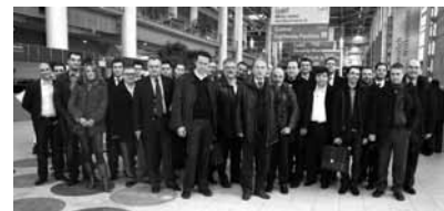
Στιγμιότυπο από την ελληνική επιχειρηματική αποστολή στη CeBIT 2009.

αντίξονη οικονομική συγκυρία, ο κλάδος της Πληροφορικής αναζητά τρόπους και κινείται δυναμικά για να δώσει διεξοδο. Προς αυτή την κατεύθυνση ιδιαίτερα σημαντική κρίνεται η στροφή προς λύσεις που υπόσχονται μείωση κόστους και ενέργειας, με παράλληλη αύξηση της αποδοτικότητας και της κερδοφορίας αντίστοιχα.